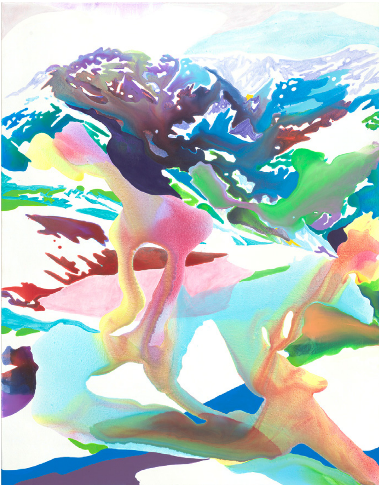
Beware of weather change | 2021 | Tusche und Acryl auf Leinwand | 180 x 140 cm