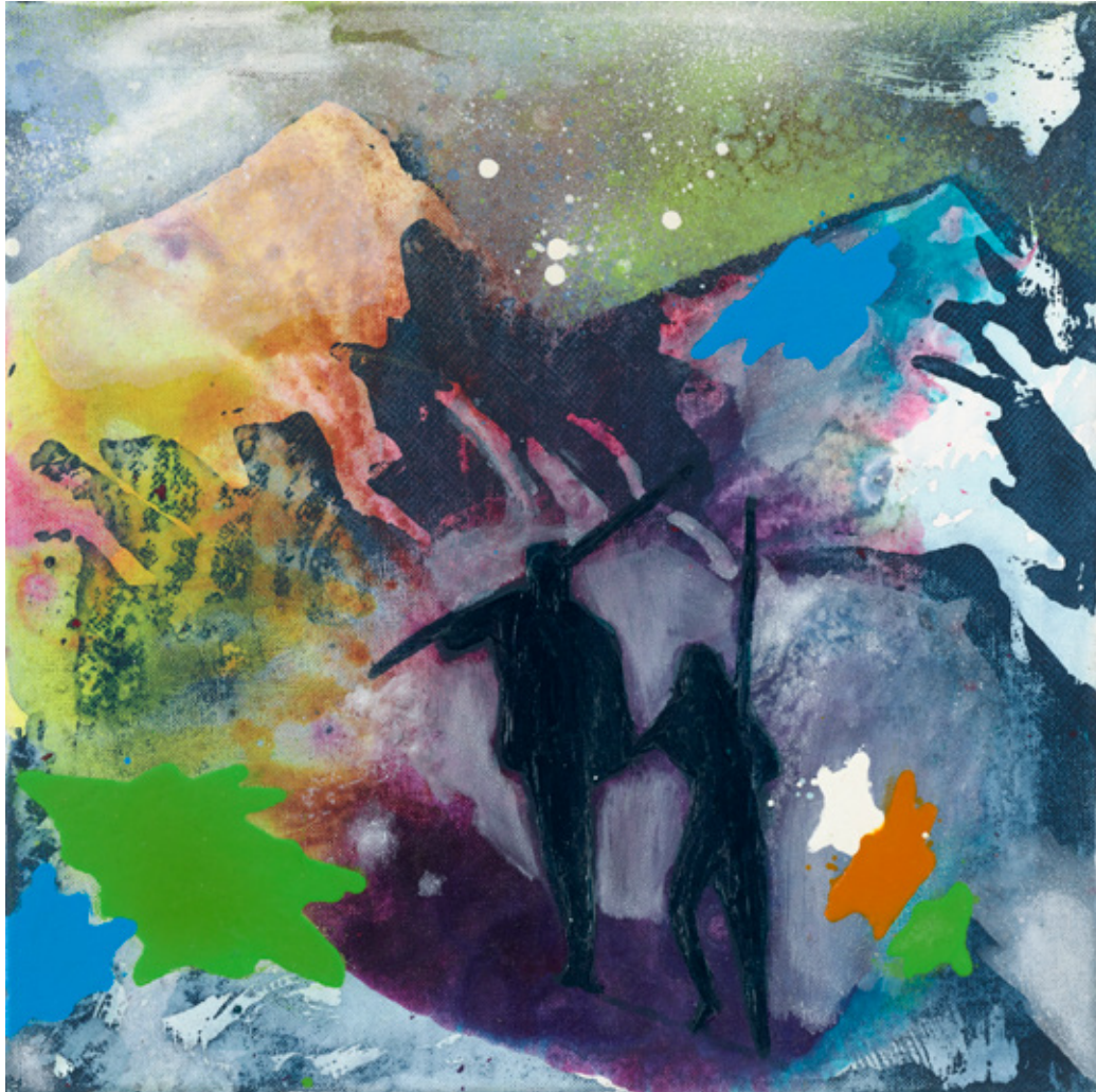
Tourismusbuero Infoportal | 2011 | Tusche, Acryl und Öl auf Leinwand | 30 x 30 cm