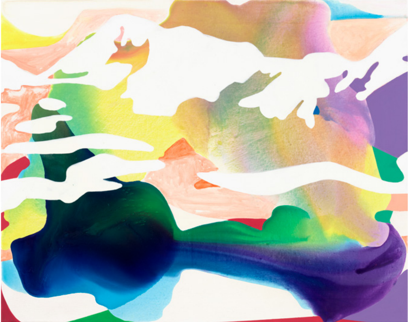
Schneefenster | 2021 | Tusche, Acryl und Öl auf Leinwand | 80 x 100 cm