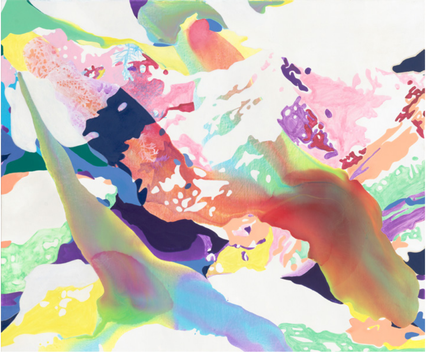
Flimmerblitz | 2021 | Tusche, Acryl und Öl auf Leinwand | 140 x 160 cm