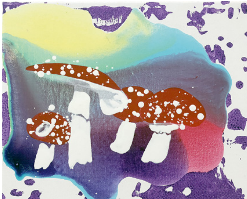
till sunbeams find you | 2019 | Tusche, Acryl, Linoldruck und Öl auf Leinwand | 25 x 30 cm

Galerie Lachenmann Art Kreuzlinger Straße 4 D - 78462 Konstanz