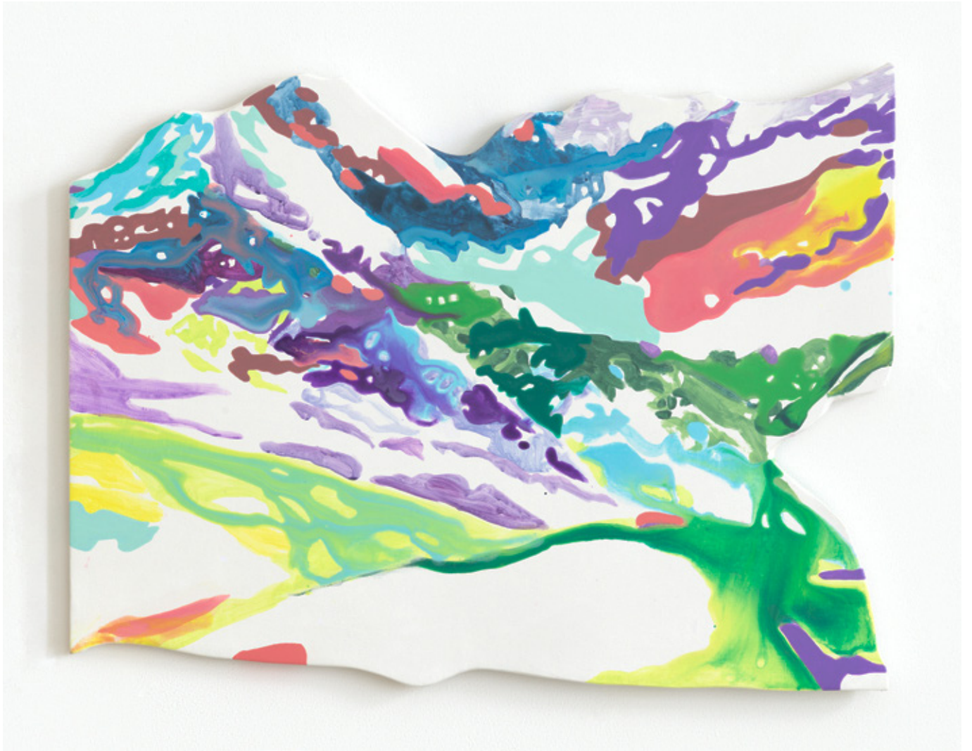
Graukogel | 2021 | Tusche und Acryl auf Leinwand | 64 x 85 cm (shaped canvas)