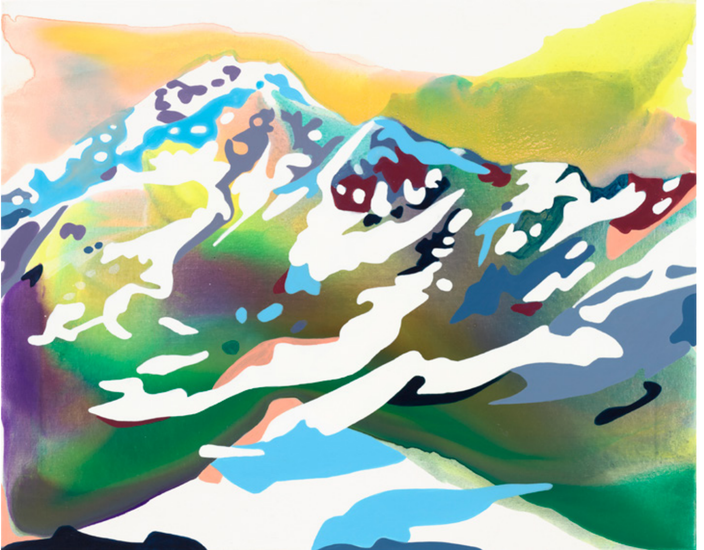
Baltoro | 2021 | Tusche, Acryl und Öl auf Leinwand | 80 x 100 cm