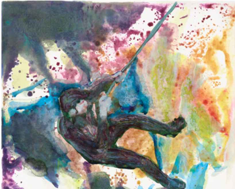
Abseilen | 2011 | Tusche und Acryl auf Leinwand | 24 x 30 cm