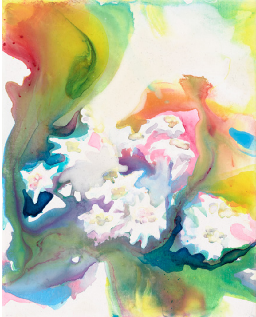
Edelweiss | 2016 | Tusche und Acryl auf Leinwand | 30 x 24 cm