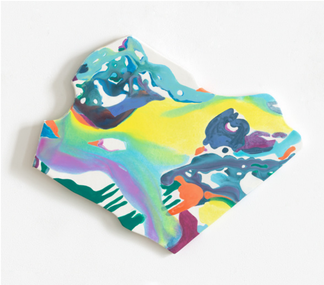
Hochvogel | 2021 | Tusche und Acryl auf Leinwand | 54 x 71 cm (shaped canvas)