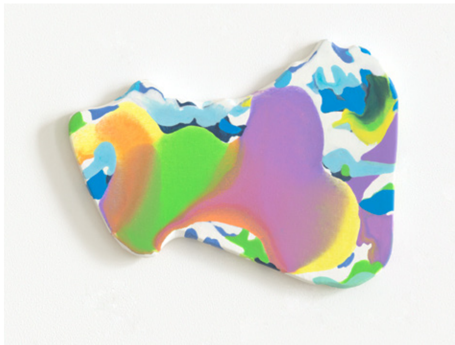
Rainbow in disorder | 2021 | Tusche und Acryl auf Leinwand | 27 x 36,5 cm (shaped canvas)